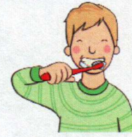
Me lavo los dientes