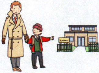
Voy al colegio