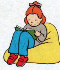
Leo un libro