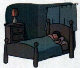
Me voy a la cama