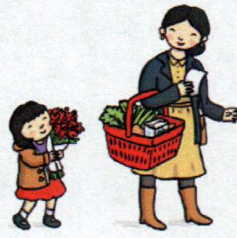
Voy de compras