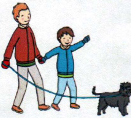
Paseo el perro