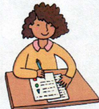
Hago los deberes